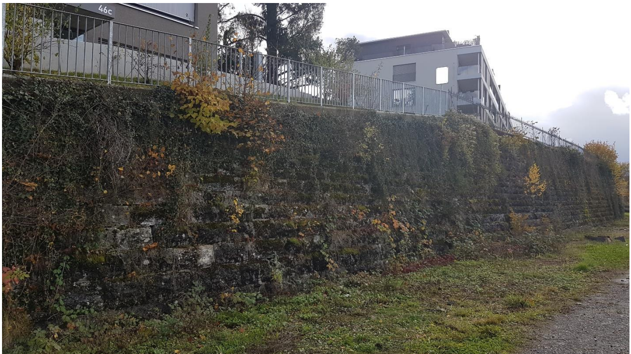
Stützmauer SBB unterhalb GB Nr. 2299