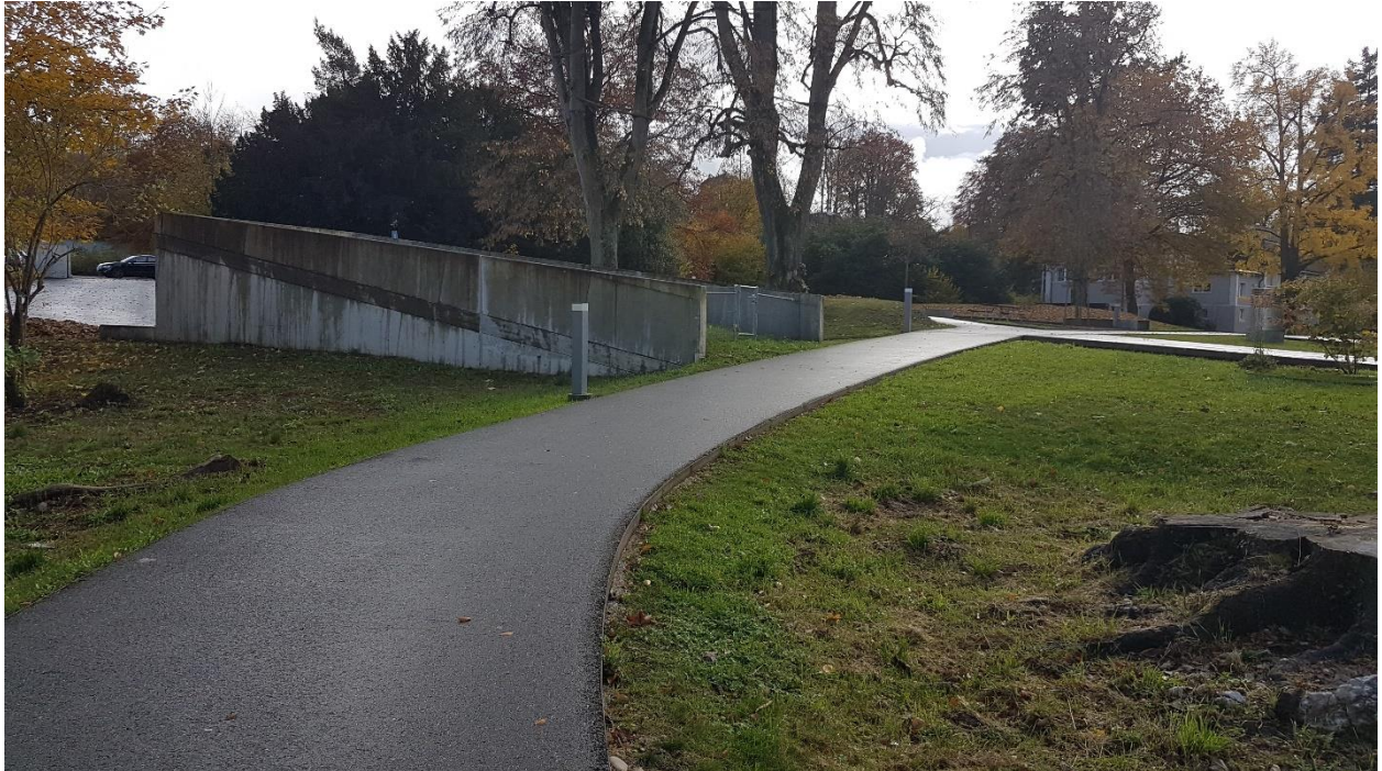
GB Nr. 261: Fussweg