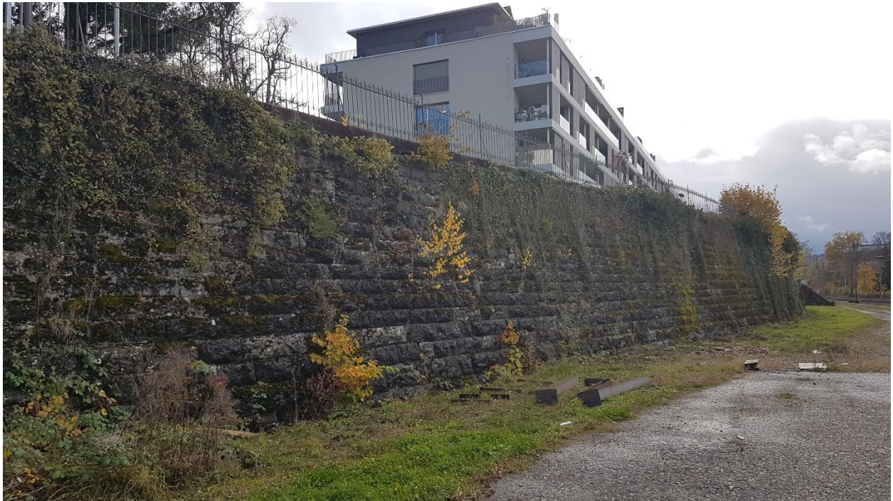
Stützmauer SBB unterhalb GB Nr. 2299