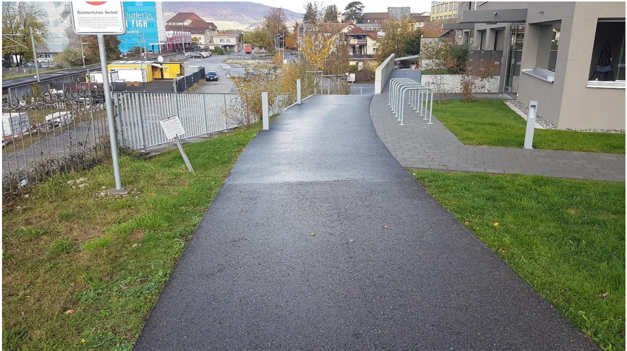
Übergang GB Nr. 261 zu GB Nr. 2299: Fussweg