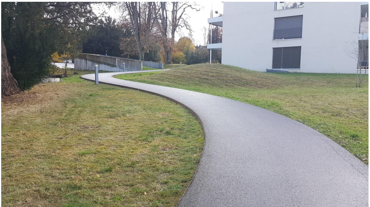
GB Nr. 261: Fussweg