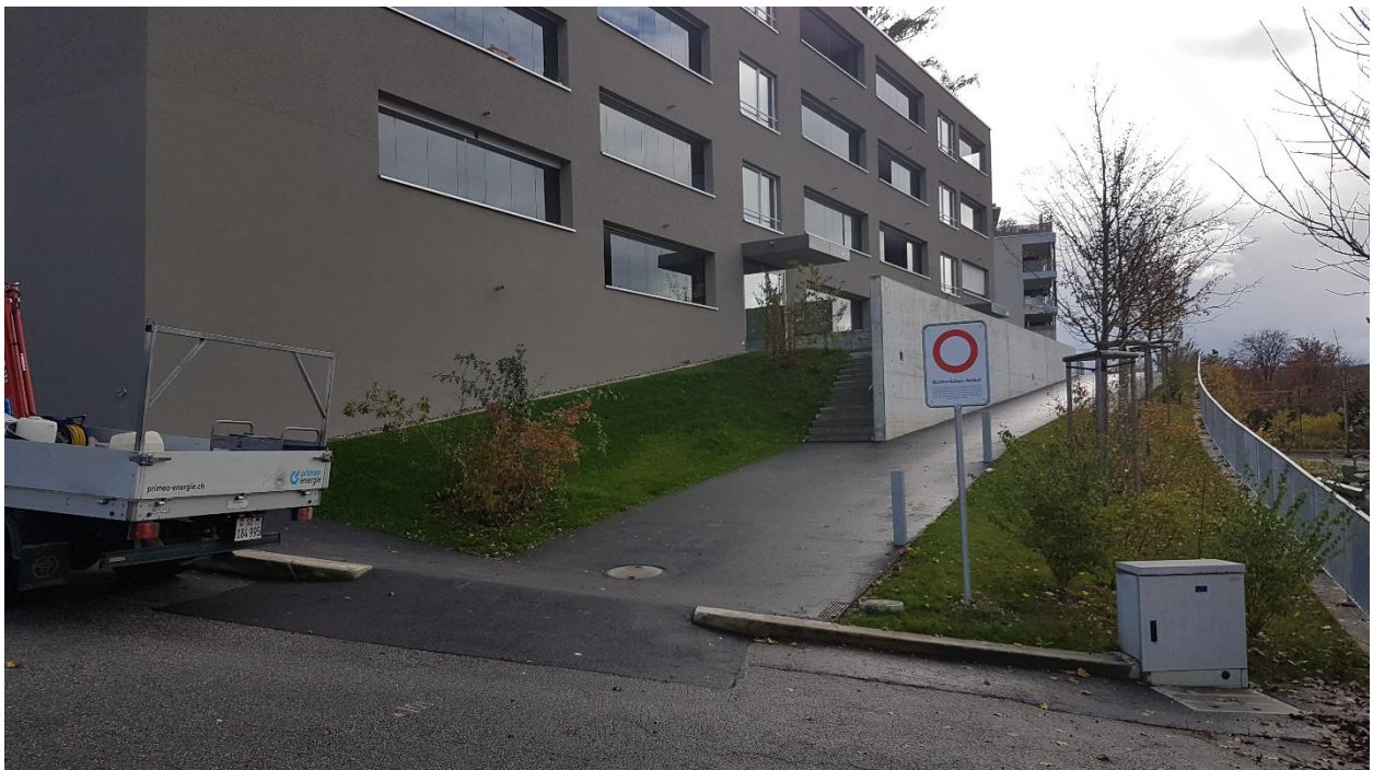
Einmündung Fussweg von GB Nr. 2299 auf Bahnhofstrasse