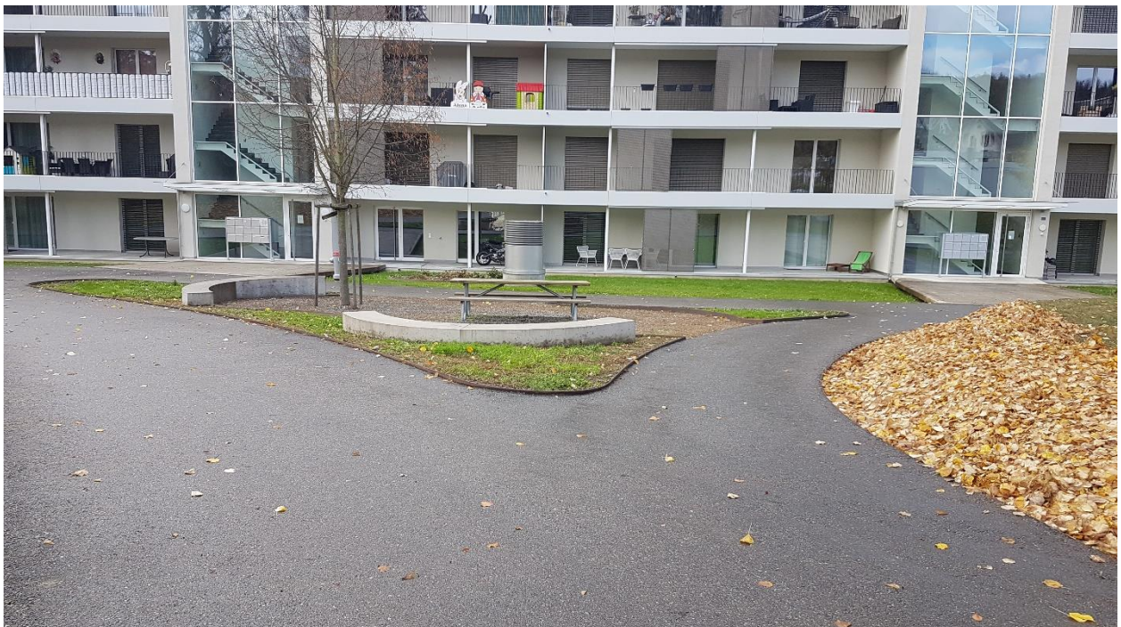
GB Nr. 261: Abzweigung Fussweg Richtung Bahnhof