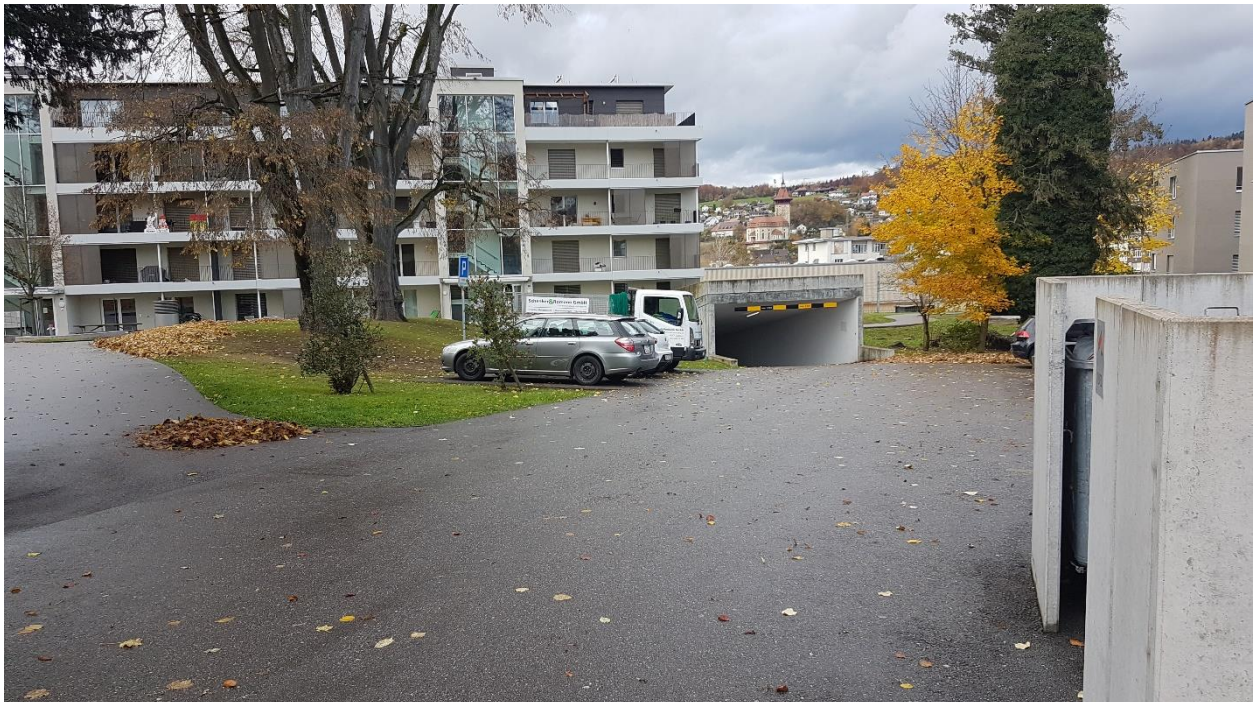
GB Nr. 261: Abzweiger Einfahrt-/Ausfahrt auf Fussweg