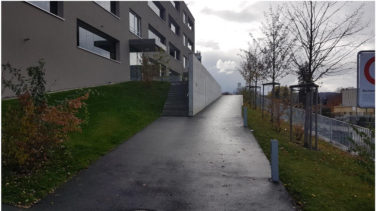
GB Nr. 2299: Fussweg