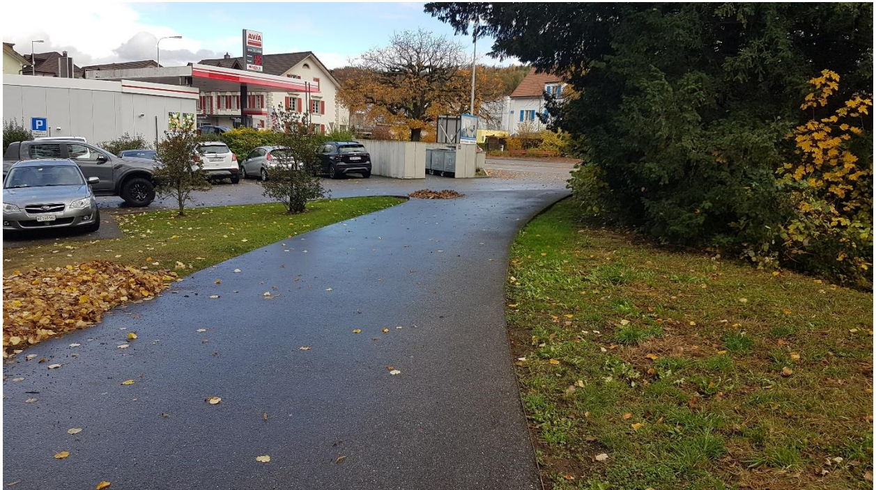
GB Nr. 261: Fussweg