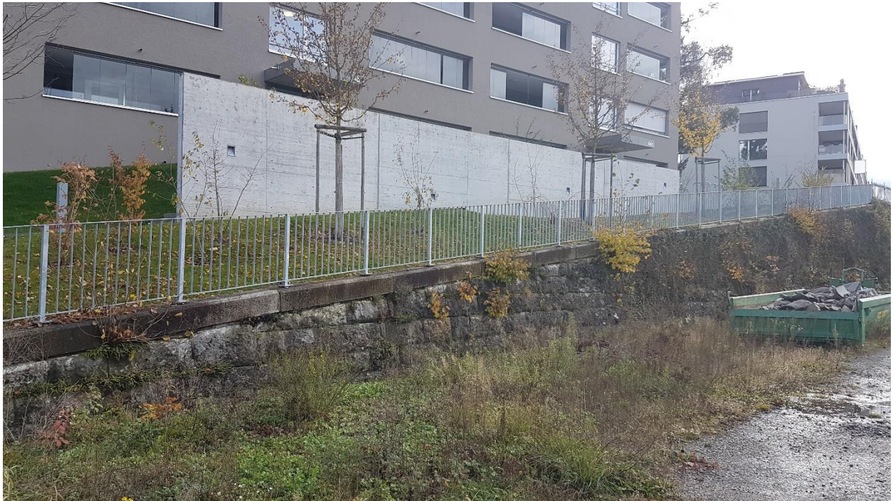
Stützmauer SBB unterhalb GB Nr. 2299