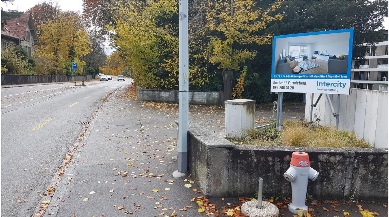
GB Nr. 261: Einfahrt-/Ausfahrt auf Oltnerstrasse

Fotoaufnahmen best. Fussweg GB Nr. 261 und best. Stützmauer SBB unterhalb GB Nr. 2299